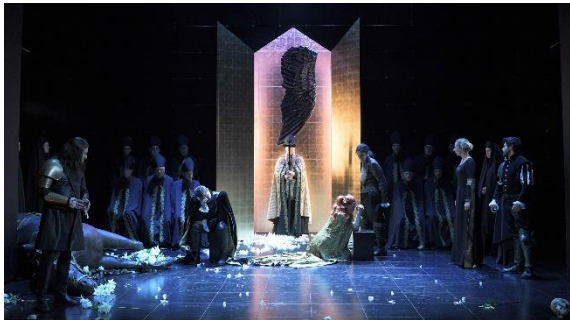
Abb. 11 Casino Theater Burgdorf, Tancredi, Oper von Gioachino Rossini

Das Programm des Casino Theaters bestand 2022 zu einem grossen Teil aus verschobenen Veranstaltungen aus den beiden Covid-Jahren 2020 und 2021.