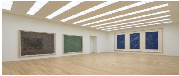
Abb. 12 Museum Franz Gertsch

Museum im Herbst sein 20jähriges Bestehen. Im Winter nahm es zum ersten Mal an der überregionalen Ausstellung zur Berner Kunst «Cantonale Berne Jura» teil.