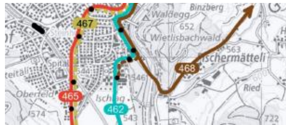
Abb. 6 Ausschnitt Variantenführung VS BOH

gesamte Busnetz um Burgdorf überprüft werden soll. Schlussendlich wurden die Arbeiten vorläufig sistiert, weil die Abstimmung zur Strassensanierung «emmentalwärts» abgewartet werden soll.