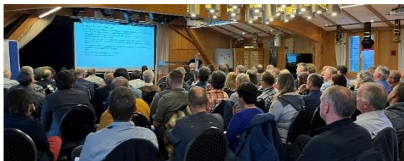
Abb. 3 Siedlungsanlass vom 5. Mai 2022 auf der Lueg

Während das Regionale Gesamtverkehrs- und Siedlungskonzept 2021 (RGSK 2021) mit dem Agglomerationsprogramm 4. Generation (AP4) erst gerade am 1. November 2021 vom Kanton genehmigt wurde, stand im Jahr 2022 bereits die Aufgleisung des RGSK 2025/AP5 im Vordergrund. Zusammen mit dem Kanton hat die Region ein Pflichtenheft erarbeitet, welches als Grundlage für das nächste RGSK dienen soll.