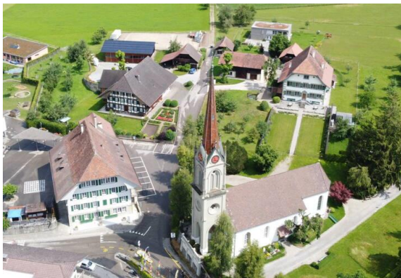
Abb. 9 Gotthelf Zentrum Lützelflüh

Das Gotthelfzentrum empfing 2022 rund 3'000 Besuchende im Museum und rund 600 Personen bei den diversen Anlässen im und um das Gotthelf Zentrum. 84 Gruppen wurden von kompetenten Gotthelf-Kenner:innen durch das Museum geleitet. Der Höhepunkt des Jahres war die Jubiläumsfeier zum 10jährigen Bestehen des Gotthelfmuseums.