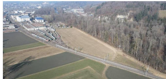
Abb. 7 Standort Werkstätte Oberburg

Im Zusammenhang mit der geplanten Werkstätte Oberburg der BLS fanden diverse Informations- und Abstimmungsbesprechungen statt.