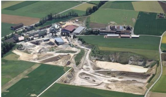
Abb. 5 Deponie Dicki in Hasle b.B.

Die thematischen Schwerpunkte im Jahr 2022 waren der Abschluss des Controlling Berichtes, die Teilrichtplananpassung ADT und das Konzept Geschiebesammler. Die zwei letztgenannten sind noch in Arbeit.