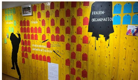
Abb. 13 Museum Schloss Burgdorf

Seit der Neueröffnung 2020 hat das Museum Schloss Burgdorf einen Schwerpunkt auf die Bildung und Vermittlung gelegt. Mit Gruppenangeboten für Schulklassen, Familien, Erwachsenengruppen, Firmen und Vereine sollen die Geschichte des Schlosses und die Ausstellungsthemen lebendig weitergegeben werden. Mit insgesamt 442 durchgeführten Angeboten im Jahr 2022 wurde ein neuer Rekord erreicht. Die Besuchendenzahlen sind im zweiten regulären Betriebsjahr mit insgesamt 23'040 Eintritten konstant geblieben. Den Jahreshöhepunkt bildete die Vernissage der Ausstellung zur Frauengeschichte in Burgdorf und im Emmental. Die Ausstellung ist gemeinsam mit Museumsbesuchenden und Frauen aus der Region entwickelt worden und bis 2027 im Museum zu sehen.