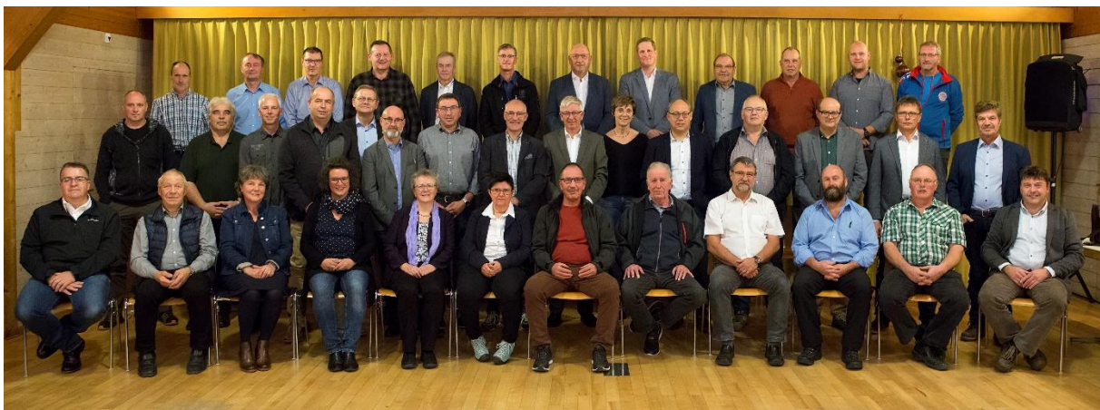
Abb. 1 Die 39 Gemeinde- bzw. Gemeinderatspräsident:innen und -präsidenten an der 24. RV vom 17.11.2022