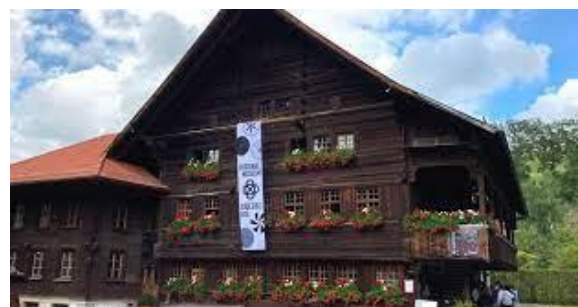
Abb. 10 Regionalmuseum Chüechlihus Langnau

Das Regionalmuseum Chüechlihus startete 2022 mit einem Pionierprojekt in der Museumslandschaft: Das Museum entschlackte die Museumssammlung, machte sie öffentlich sichtbar und führte sie zusammen mit der Emmentaler Bevölkerung durch. Das Besondere an der Aktion war, dass sie ungewöhnlich transparent und zusammen mit der Bevölkerung durchgeführt wurde. Rund 7'000 Menschen haben das Regionalmuseum im Jahr 2022 besucht.