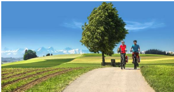
Abb. 8 Visualisierung Hügu-Himu Emmental

Im Jahr 2022 durfte das Emmental in die zweite «Hügu Himu» Saison starten. Die Emmentaler Gastgeber:innen durften wiederum zahlreiche glückliche Gäste empfangen. Gemäss Rückmeldungen der Hotel-, Gastro- und Parahotellerie-Betriebe war der Zuwachs von Radwander-Gästen deutlich spürbar. Mit über 450 km ausgeschilderten E-Bike Routen öffnet sich ein wahres Paradies für die genussvollen Radwanderfans. Zahlreiche buchbare Mehrtagesangebote wurden durch die Leistungsträger in Zusammenarbeit mit Emmental Tourismus lanciert. Zudem konnten wieder attraktive Aktionen auf die E-Bike Miete mit «Rent a Bike» umgesetzt werden, so zum Beispiel im Migros Sammelpass.